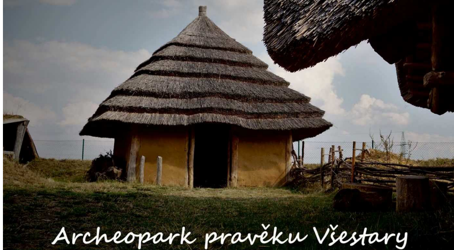
Archeopark pravěku Všeštery