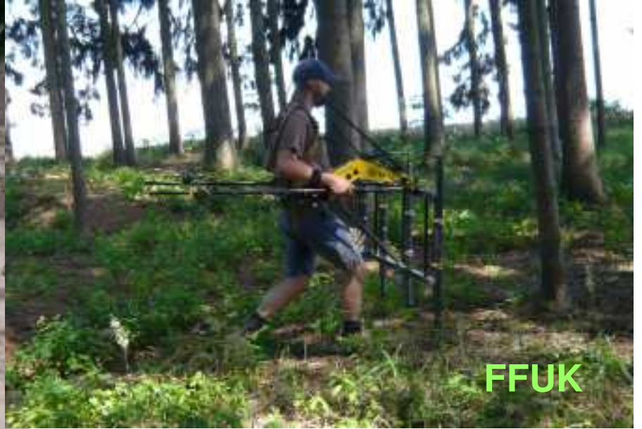
Vojenice (RK) – letní praxe FFUK