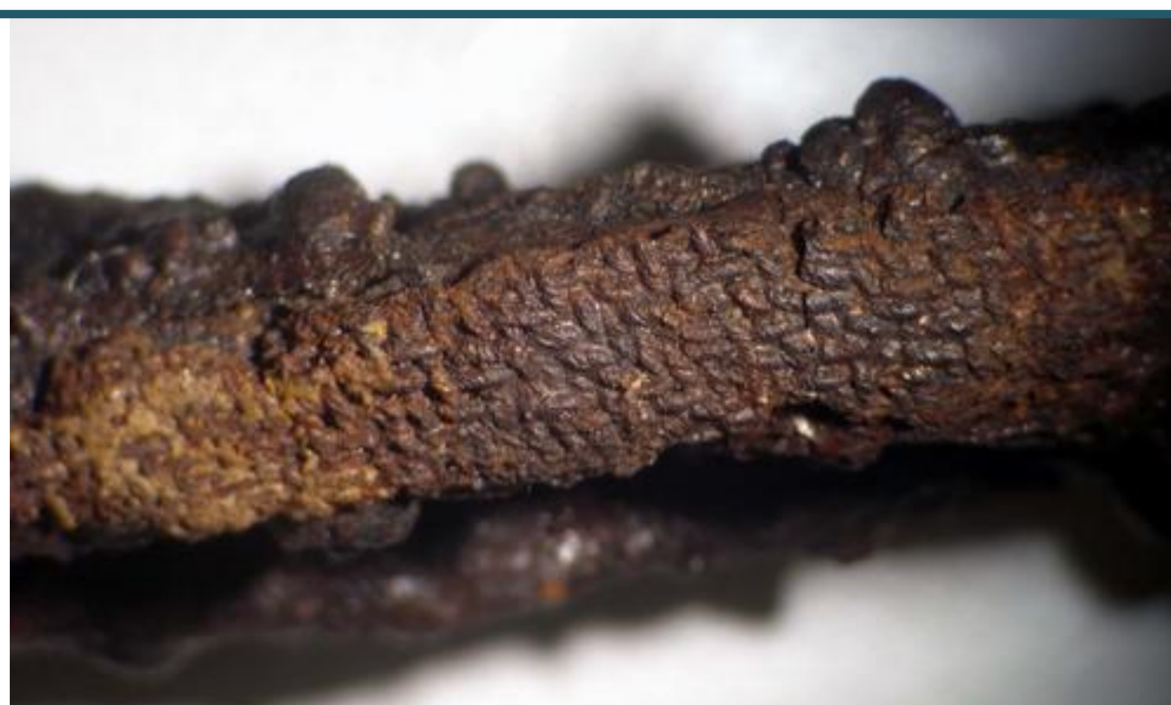
↑ Fotografie textilu dochovaném na předmětu inv.č. 51302 z rozrušených hrobů v Praze Podbabě. Na prvním obr. mikroskopický snímek, na druhém v vyznačeném schématu keprové vazby – hrotitého vertikálního kepru. Vzhledem k drobnosti fragmentu však nelze vyloučit, že se jedná také o kepr „diamantový“.