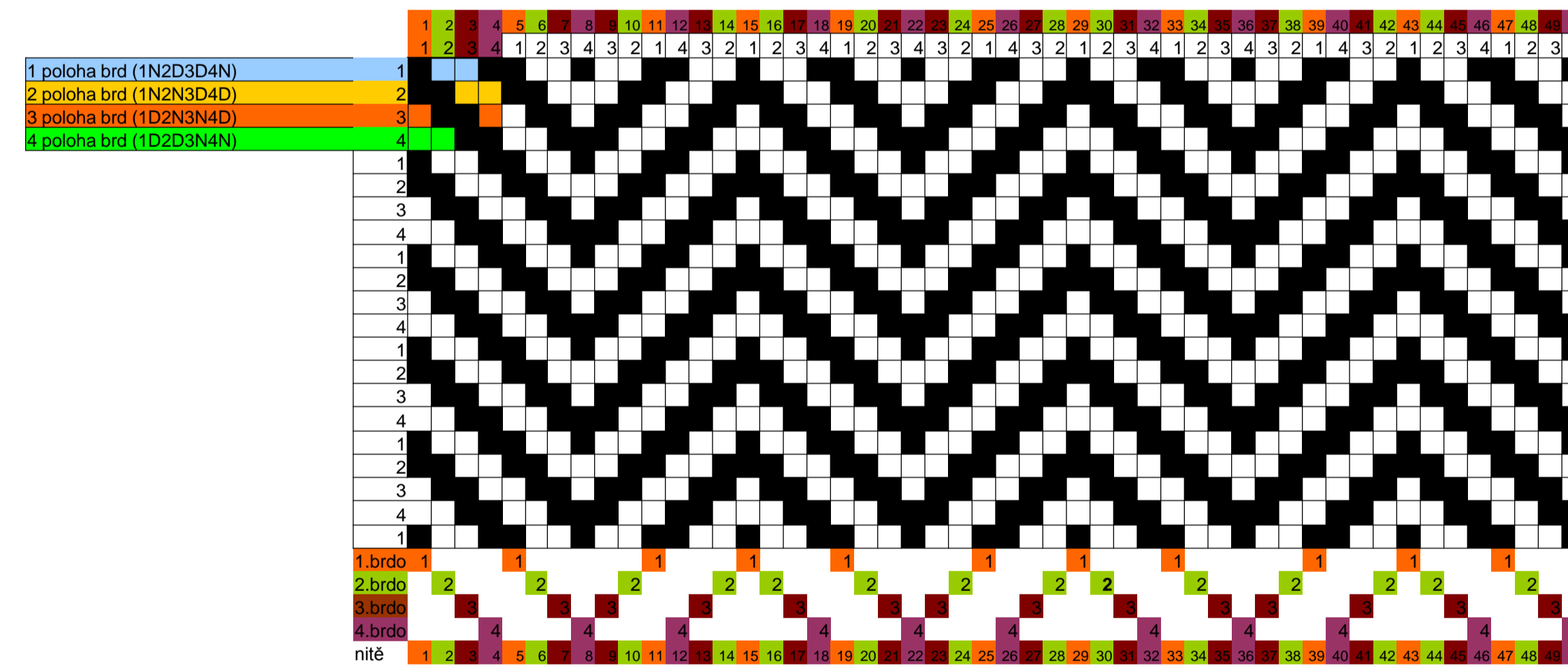
Schéma hrotitého vertikálního kepru.

■ osnovní vazný bod (osnova je nahoře nad útkem; brdo nahoře N) □ útkový vazný bod (útek je nahoře nad osnovou; brdo dole D)