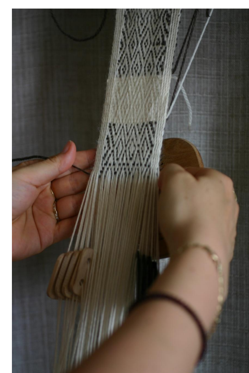
Postup práce – tkaní keprové vazby.

Okraje vznikající tkaniny jsou efektně zpevněny tkaním na destičkách zavěšených na okrajových osnovních nitích.