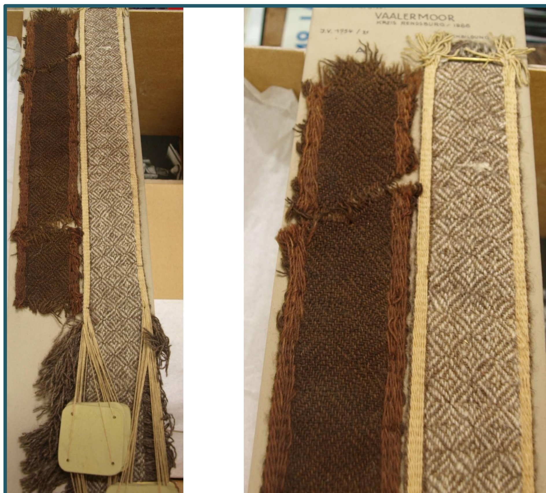
↑ Pásek z Vaalermoor, vlevo originální nález, vpravo rekonstrukce původního vzhledu.

V pravěké textilnictví byly používány 2 základní typy tkalcovské vazby – plátňová a keprová, každá v několika různých variantách. Jedna z nejpůsobivějších a technologicky nejsložitějších je vazba označovaná názvem „diamantový kepr“. V evropských archeologických nálezích textilních fragmentů se s tímto typem vazby setkáváme ojediněle od doby bronzové, nejvíce nálezů je z doby římské a stěhování národů.